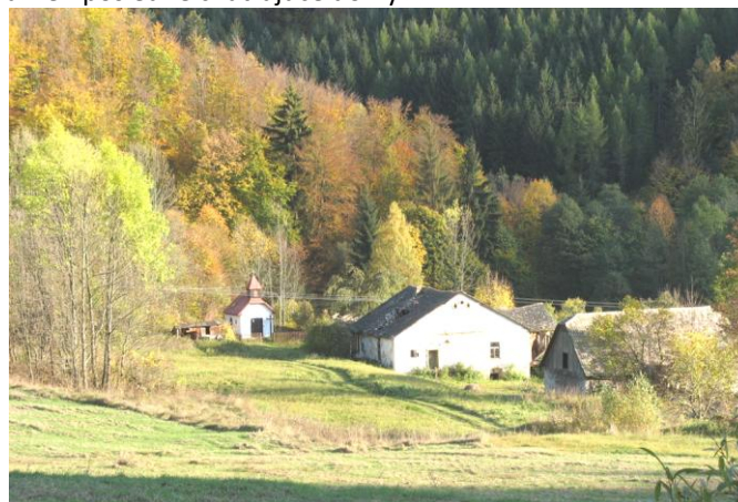
Lokalita vo Vlčove kde v r. 1869 až 1924 stála skláraň

Keď prechádzame cestou z Málinca proti prúdu toku Ipľa smerom na Látky v dnešných časoch, nič nesvedčí o tom, že úzka dolina v minulosti prekypovala životom. Úpadok začal krátko po skončení 1. sv. vojny. Vyvrcholil po dostavbe vodnej nádrže nad Málincom (r. 1993), keď posledné tam žijúce rodiny sa postupne vysťahovali. Život z minulosti pripomínajú už len posledné chátrajúce domy.