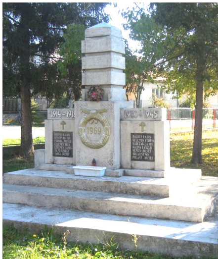
Pomník padlým v I. a II. sv. vojne