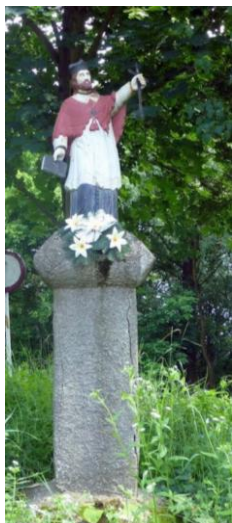
Socha sv. Jána Nepomuckého